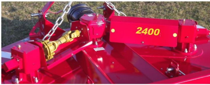
Transmission de la puissance par boîtier + cardans (boîtier principal 125cv / boîtiers latéraux 65cv)