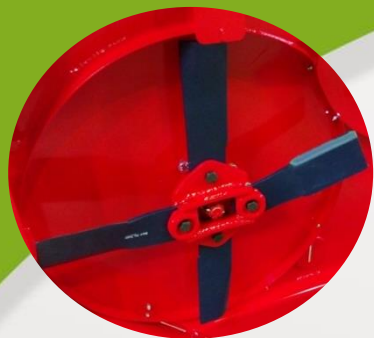
3 rotors à 2 lames aspirantes épaisseur 12mm → Coupe nette, broyage parfait → Rotor prédisposé pour montage 4 lames