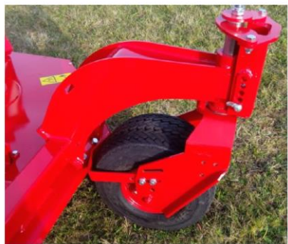
Option roues arrière pivotantes 360° 460x212