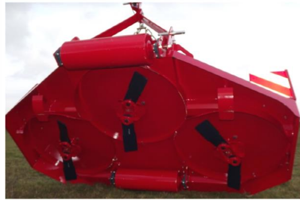
Option deux rouleaux intégrés avant et arrière → Hauteur de travail réglable → Excellent suivi du terrain