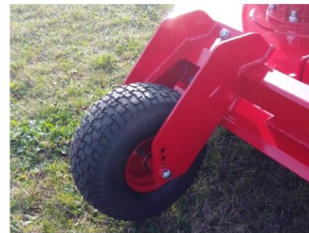
Hauteur de coupe réglable de 4 à 14 cm par deux roues arrière ø360 fixes de série